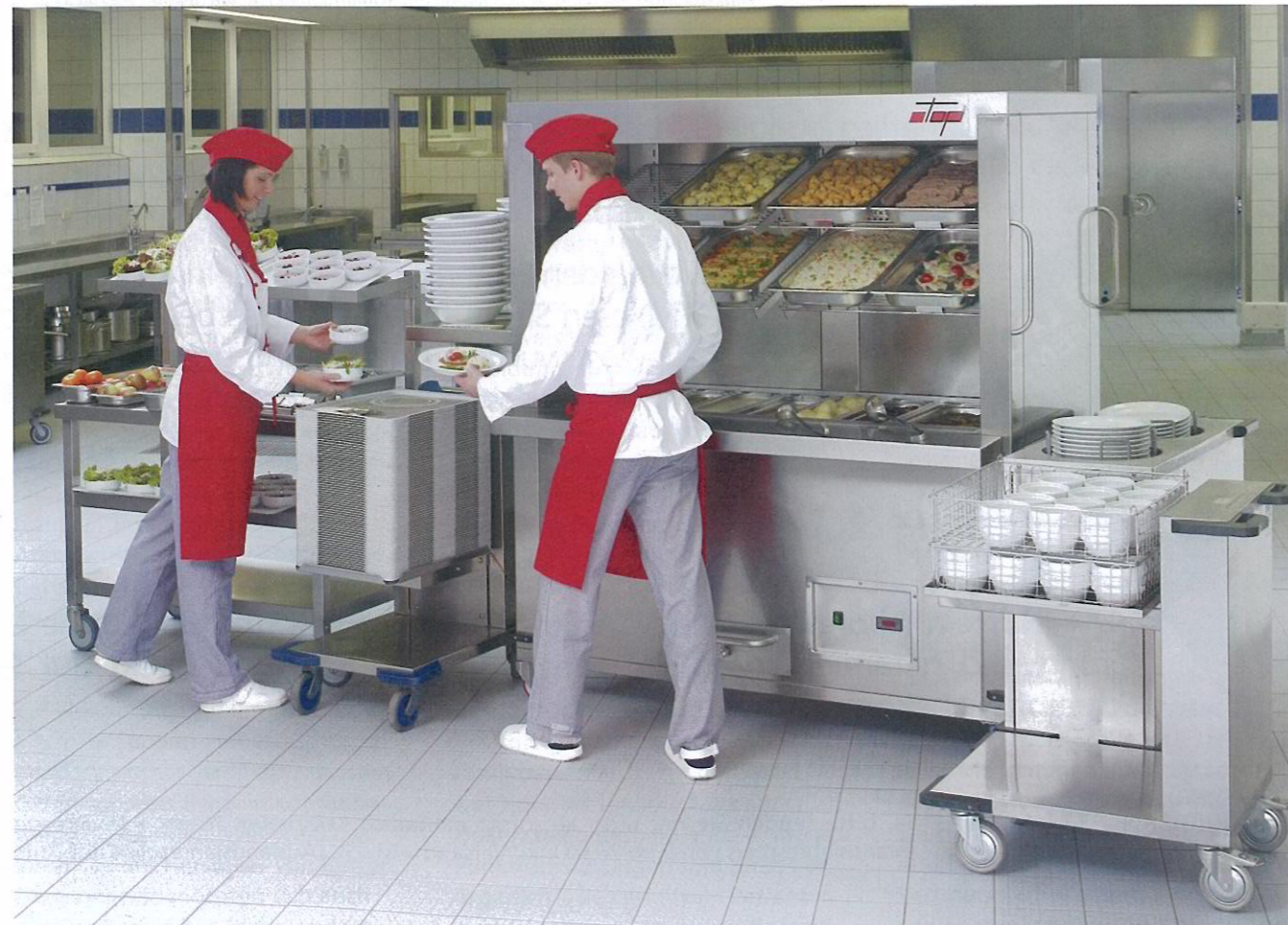
Mitarbeiter begrüßen das System und fühlen sich im normalen Raumklima deutlich wohler als früher in der Kälte mit spezieller Schutzkleidung. Diese muss nun weder angeschafft noch gewaschen werden.

licht die Speisenverteilung für gängige Zubereitungsverfahren wie Cook & Chill, Cook & Serve und andere. In Großkliniken lassen sich die mobilen und platzsparenden