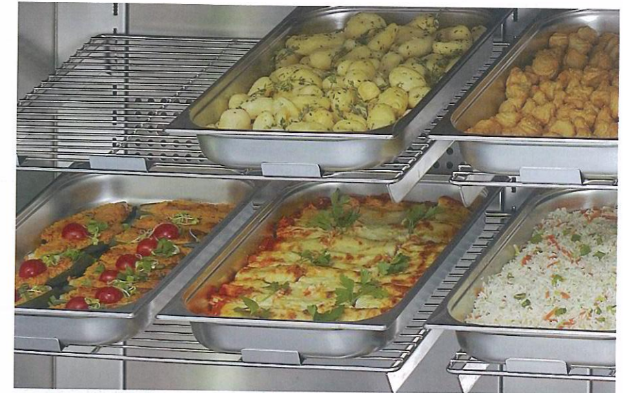
Die Anrichtesysteme bieten viel Platz und können flexibel und variabel bestückt werden.

Die visuelle Anrichtequalität erhöht sich nicht zuletzt deshalb, weil die Mitarbeiter verantwortungsvoller arbeiten und sich jede Charge nachverfolgen lässt. „Was gut aussieht, schmeckt automatisch besser“, weiß der gelernte Koch. Und da beim Essen schließlich jeder Patient mitreden kann, lässt sich mit größerer Patientenzufriedenheit letztendlich auch das Image eines Hauses erhöhen. Die durchdachten und in vierjähriger Entwicklungsarbeit entstandenen Anrichtesysteme ermöglichen neben der Anrichtequalität auch eine entsprechende Tablettquote. Messungen des Herstellers bei ersten Anwendern erbrachten bereits in der ersten Woche eine Zeitersparnis von bis zu 32 Prozent. Beispielsweise haben in einem mittleren Haus vier Mitarbeiter 360 Tablett je Mahlzeit mit sehr geringem Gesamtzeitaufwand angerichtet. „Da kamen sogar 45 Prozent Zeitvorteil heraus“, berichtet Metze. Die Mitarbeiter begrüßen das Sys-